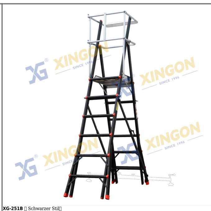
XG-251B □ Schwarzer Stil□