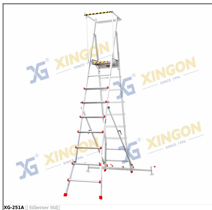
XG-251A □ Silberner Stil□

Äußerst Langlebig und bietet überragende Festigkeit. Die Profi-Serie vereint eine Vielzahl zusätzlicher Funktionen und Vorteile. Sie verfügt über eine robuste Aluminiumkonstruktion und ist für eine Tragfähigkeit von 150 kg ausgelegt.