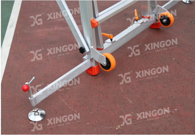
Verstärken Sie die Diagonalstrebe