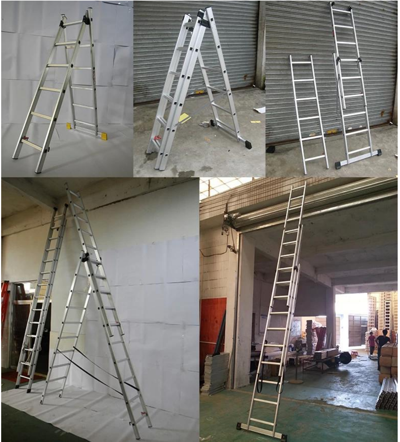
Heavy Gauge Steel Bracket engagiert Steel Pin to Lock Abschnitt in Step Ladder Position