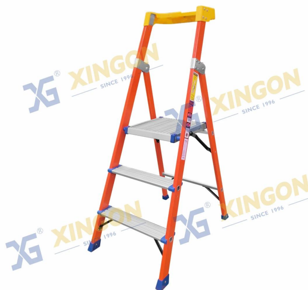
XG-352F [Fibra di vetro] - versione standard -