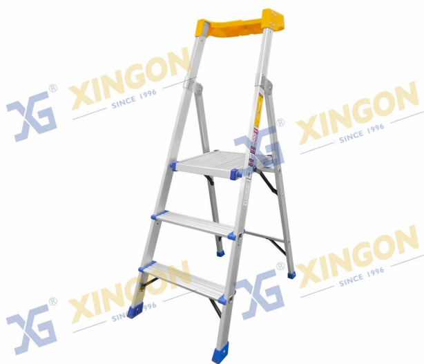
XG-352A [Alluminio] - versione Norma -

Altamente durevole e offre una resistenza superiore, combinando una serie di caratteristiche e vantaggi aggiuntivi, la gamma professionale è caratterizzata da una struttura in alluminio e fibra di vetro per carichi pesanti e ha un carico nominale di 150 kg.